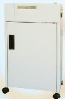
S-280A 長條狀 C-280A 短碎狀

便利、安全、可信賴的高品質碎紙機，多種款式、多種功能、多重選擇，包括碎紙尺寸，手動或自動操作和置紙寬度，不論如何使用，都可以為您處理私人或辦公室內機密的文件。