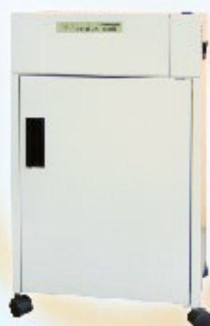
S-300A 長條狀 C-300A 短碎狀